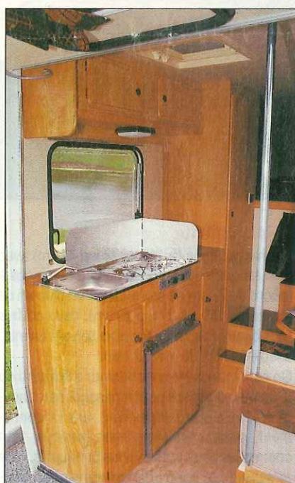
2. Les rangements ne sont pas oubliés dans cette petite cuisine.